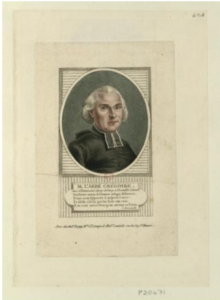
L'Abbé Grégoire

"Rapport sur la nécessité et les moyens d'anéantir les patois et d'universaliser l'usage de la langue française"