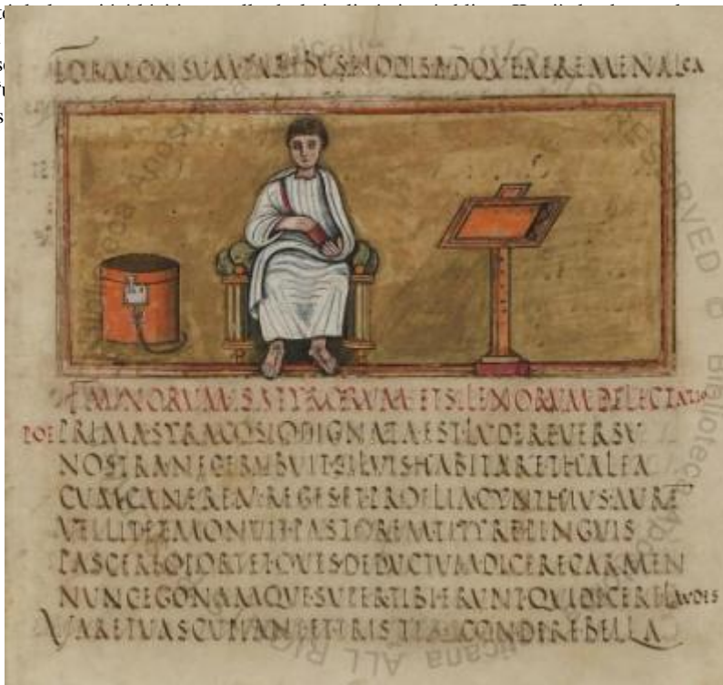
Folio 14 du Vergilius Romanus. Ve siècle

Il faut d'abord rappeler ce principe fondamental de sociolinguistique qui est celui de la variation existante dans toutes les langues vivantes. Le latin n'était pas une exception : loin de l'idée que l'on a souvent d'une langue homogène, fixée à jamais, il faut considérer qu'à côté de la langue écrite durant des siècles, on trouve de nombreuses variables dans tous les domaines. Il ne faut donc le définir comme un diasystème, c'est-à-dire une armature stable commune et des variables qui ne sont pas (Banniard 1997: 23).